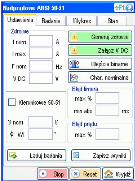
Przygotowanie badania - moduł nadprądowy