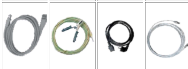
Standardowy zestaw przewodów