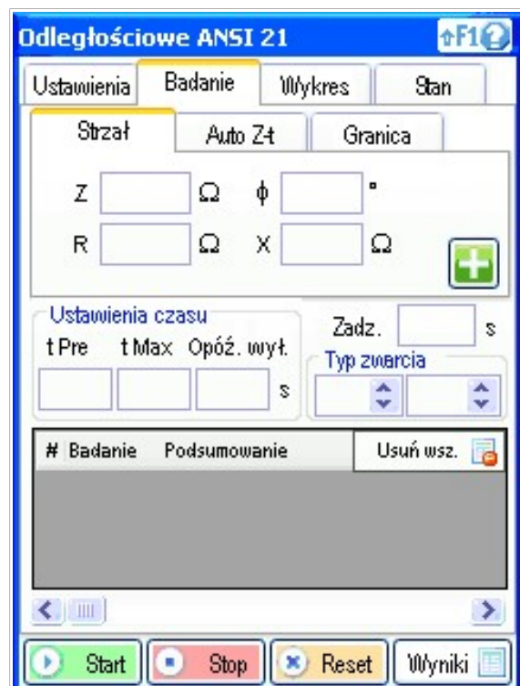
Przygotowanie badania - moduł odległościowy