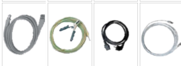
Standardowy zestaw przewodów