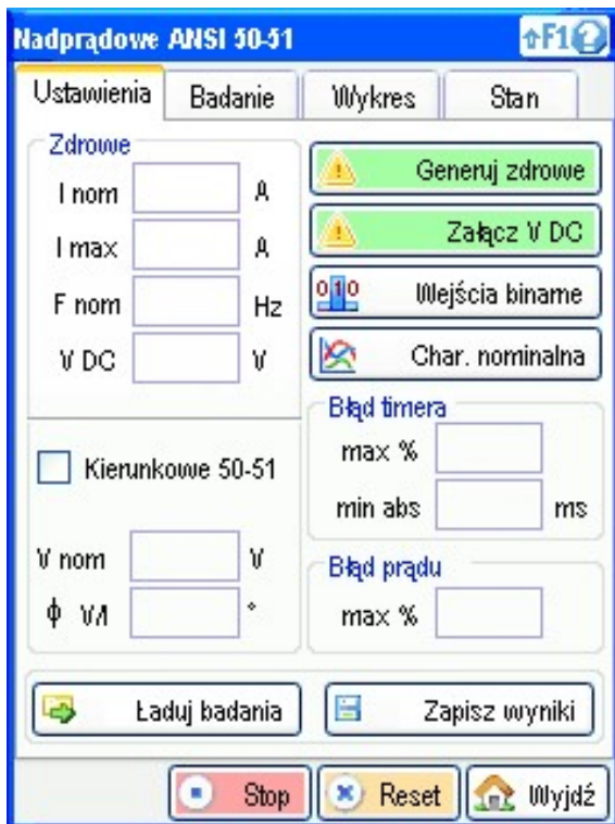
Przygotowanie badania - moduł nadprądowy