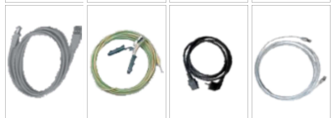
Standardowy zestaw przewodów