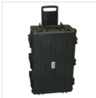
Walizka z tworzywa sztucznego