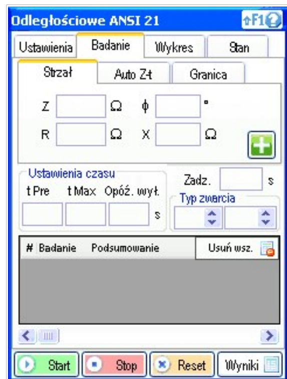
Przygotowanie badania - moduł odległościowy