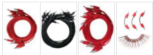
Dodatkowy zestaw przewodów pomiarowych

Opcjonalny zestaw przewodów pomiarowych, umożliwiający podłączenie testera do większości stosowanych konektorów. Zawiera 20 różnych adapterów do zacisków szynowych i 3 zworki do równoległego łączenia wyjść prądowych.